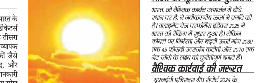
हरिभूमि न्यूज ►► नई दिल्ली विश्व भर के 60 प्रतिष्ठित वैज्ञानिकों, जिनमें भारत के दो वैज्ञानिक शामिल हैं, सबने मिलकर इंटीकेटर्स ऑफ ग्लोबल क्लाइमेट चेंज 2024 नामक तीसरा वार्षिक अद्यतन प्रकाशित किया है। यह व्यापक रिपोर्ट जलवायु परिवर्तन के प्रमुख संकेतकों जैसे ग्रीनहाउस गैस उत्सर्जन, समुद्र तल वृद्धि, और पृथ्वी की ऊर्जा असंतुलन पर गंभीर जानकारी प्रस्तुत करती है। कांग्रेस के वरिष्ठ नेता जयराम रमेश ने आज इस रिपोर्ट पर अपने एकस पोस्ट में चर्चा की, जिसमें उन्होंने जलवायु परिवर्तन की गंभीरता और कुछ सकारात्मक संकेतों पर प्रकाश डाला।

जयराम रमेश ने लिखा, "विश्व भर के प्रतिष्ठित संस्थानों के 60 वैज्ञानिकों, जिनमें भारत के दो वैज्ञानिक शामिल हैं, ने वैश्विक जलवायु परिवर्तन संकेतकों का तीसरा वार्षिक अद्यतन प्रकाशित किया है। यह एक व्यापक विश्लेषण है। इस अद्यतन में आशा की एक हल्की सी किरण है कि पिछले दशक में कार्बन डाइऑक्साइड उत्सर्जन की वृद्धि दर 2000 के दशक की तुलना में धीमी हुई है।" उन्होंने आगे कहा कि समुद्र तल वृद्धि तेज हो रही है, पृथ्वी की ऊर्जा असंतुलन बढ़ गया है, और सभी ग्रीनहाउस गैसों का वर्तमान उत्सर्जन स्तर 1.5 डिग्री सेल्सियस की सीमा को पांच वर्षों में पार कर सकता है। उन्होंने यह भी उल्लेख किया कि 2024 अब तक का सबसे गर्म वर्ष था। आशा की किरण, पर चुनौतियाँ बरकरार रिपोर्ट में एक सकारात्मक संकेत है कि पिछले दशक (2014-2023) में कार्बन डाइऑक्साइड उत्सर्जन की वृद्धि दर 2000 के दशक की तुलना में धीमी हुई है। 2010 के दशक में 2.5 फीसदी प्रति वर्ष की वृद्धि दर 2020 के दशक में घटकर 1 फीसदी प्रति वर्ष हो गई है। यह सौर, पवन ऊर्जा और हल्वेक्टिक वाहनों के बढ़ते उपयोग का अमेरिका की नीतियों का प्रभाव रिपोर्ट में कहा गया है कि अमेरिका की वर्तमान जलवायु नीतियाँ 1.5 डिग्री सेल्सियस की सीमा को और पहले पार करने का जोखिम बढ़ा सकती हैं। हालांकि, अमेरिका में इन्फ्लेक्शन रिडक्शन एक्ट ने स्वच्छ ऊर्जा में निवेश बढ़ाया है, फिर भी जीवाश्म ईंधन पर निर्भरता एक चुनौती है।