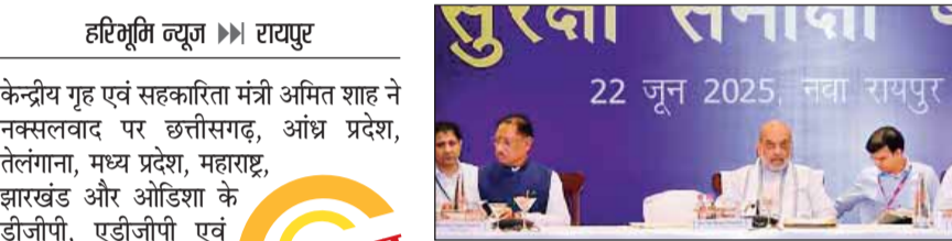
हरिभूमि न्यूज ►► रायपुर केंद्रीय गृह एवं सहकारिता मंत्री अमित शाह ने नक्सलवाद पर छत्तीसगढ़, आंध्र प्रदेश, तेलंगाना, मध्य प्रदेश, महाराष्ट्र, झारखंड और ओडिशा के डीजीपी, एडीजीपी एवं वरिष्ठ अधिकारियों के साथ रायपुर में समीक्षा बैठक की अध्यक्षता की।